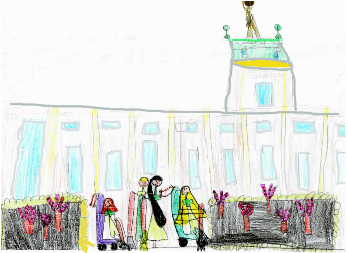
Kwiecień. Z grabiami i miotłami witamy wiosnę w Ogrodzie Różanym.